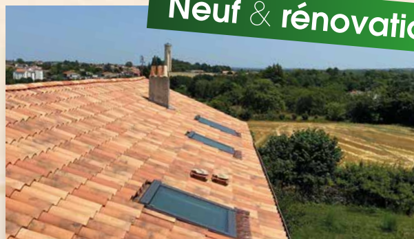
Rénovation de couverture

5 route de la Croix Blanche, 16800 SOYAUX 05 45 95 23 07 / f.o.b@orange.fr